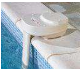
Norme NF P90-307-1