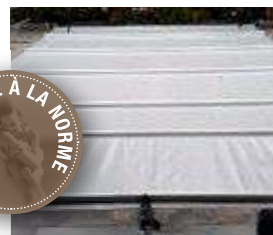
Norme NF P90-306